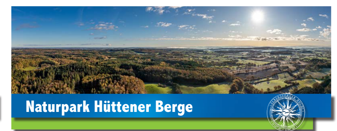
Naturpark Hüttener Berge

Der Naturpark Hüttener Berge... ... wurde durch die letzte Eiszeit geprägt. Sanfte, nicht zu hohe Berge wechseln sich mit sehr schönen Seen ab. Hier lässt es sich wunderbar wandern, radfahren und vor allem erholen. Entdecke Land und Leute und genieße, dass hier alles etwas entspannter ist. Für Pferdeliebhaber gibt es zahlreiche Höfe und Ställe. Hast Du Lust auf Urlaub auf dem Bauernhof? Dann bist Du hier richtig! Gerne führen wir Dich auch durch den Naturpark. Frag nach unseren Guides.